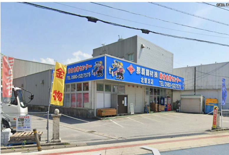
↑「あの娘」の勤め先 中部那覇鋼材 北部支店