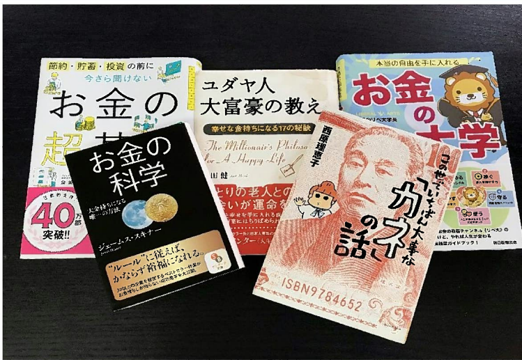
↑お金・お金・お金の本ww