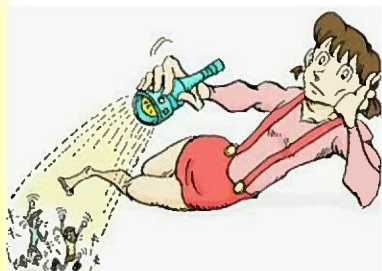
【一真教訓】 飲んだら飲まれるな! 飲まれるなら飲むな!

かなり酔っ払い、一人では帰れないと判断した友人は僕をお家で送ってくれました。短時間で私は壊れましたので、お家についてから妻は起きていました。何を考えていたのか・・・