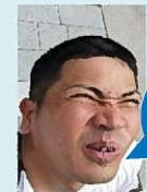
編集者より ひとこと

昭和51年12月6日生 いて座 O型 一真の日常の3つの確認 1位: 筋肉痛の確認 2位: 風呂後の鏡の確認 3位: 足の体毛確認