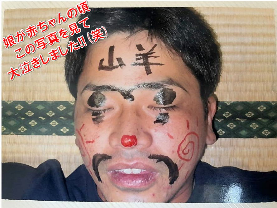
娘が赤ちゃんの頃 この写真を見て 大泣きました!! (笑)