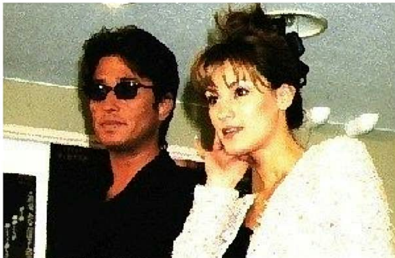
↑多くTV番組で話題になりました...