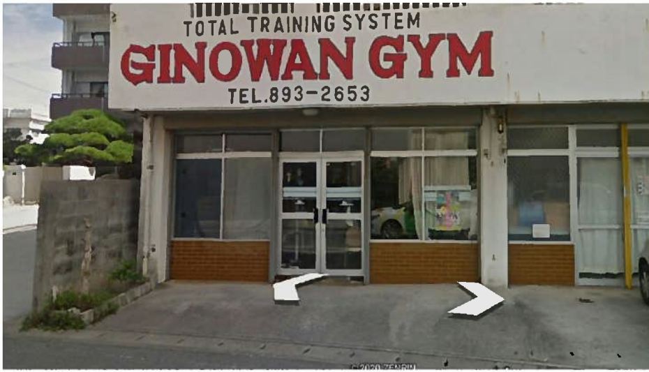
↑どこからどうみても入りにくい怪しいジム構え(笑)