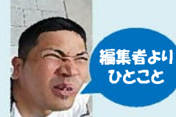
編集者よりひとこと

昭和51年12月6日生 いて座 O型 細マッチョ目指す短足 43歳 鉄と鏡をこよなく愛す