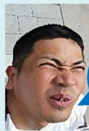
編集者より ひとこと