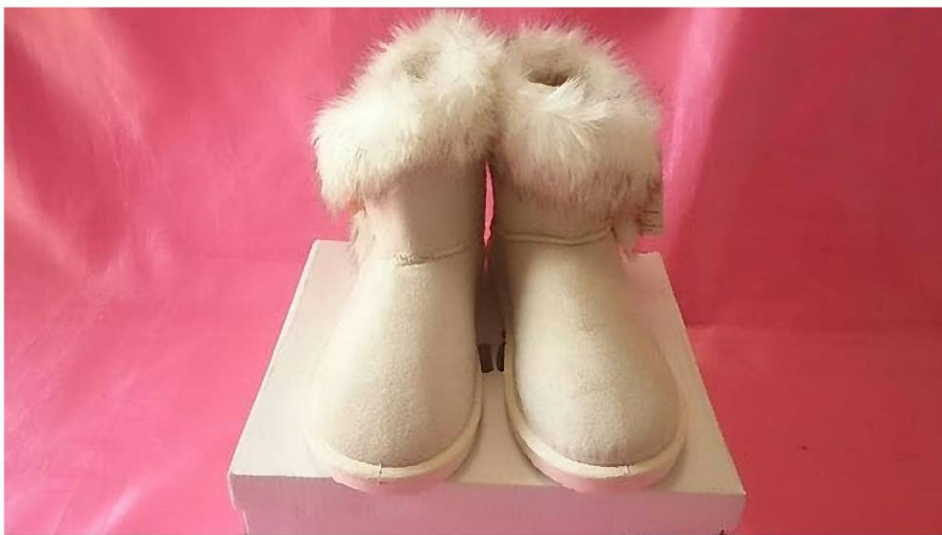
↑これがショートムートンブーツ。実際にはもっとふさふさだったけど…夏に着こなせるのは流石！！