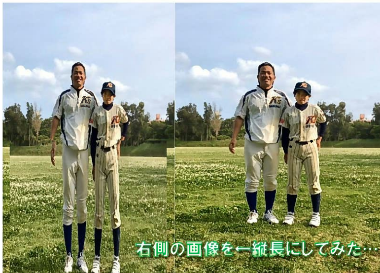
右側の画像を一縦長にしてみた...