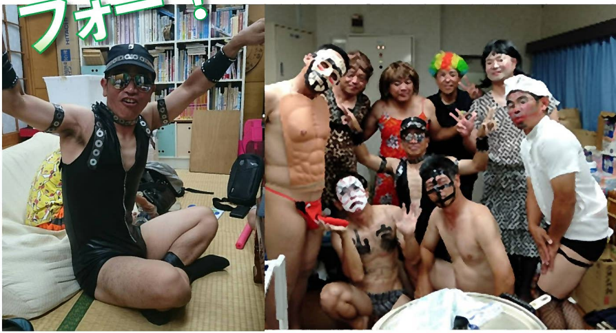
↑この懐かしのキャラは？