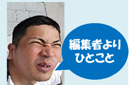
編集者より ひとこと

昭和 51 年 12 月 6 日 生 いて座 O 型 キャビキャビの42歳 基本的に超短足かも… （余興練習動画を確認中 に相方が自分とほぼ同じ 身長なのに、自分の方 の足がかなり短い事に気づ いて凹んだ富名腰）